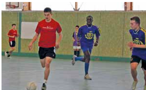
Match à Angers salle Bertin lors des qualifications régionales.

L'équipe cadette de futsal du lycée Joseph Wresinski a frappé très fort ce mercredi 8 avril en se qualifiant pour la phase finale nationale.