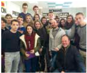
Rencontre avec l'équipe artistique au lycée.

Les Caprices de Marianne est une pièce d'Alfred de Musset écrite en 1833. Cette œuvre appartient au mouvement romantique. L'histoire parle d'un jeune homme nommé Coëlio amoureux de Marianne mariée à Claudio. Le prétendant va se faire aider d'Octave pour la courtiser... Après avoir étudié la pièce, nous avons eu la chance d'aller la voir jouer au Nouveau Théâtre d'Angers, puis d'assister à une rencontre avec l'équipe artistique. Pour terminer cette aventure, nous avons reçu deux des acteurs de la pièce au sein même du lycée. C'est avec plaisir que nous avons partagé un moment de complicité et avons redécouvert le théâtre classique.