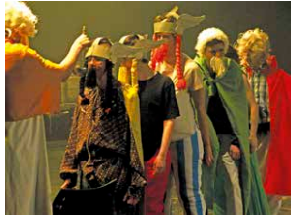
Astérix et Obélix : c'est l'heure de la potion magique (classe ULIS).