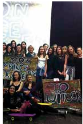
Les 2ASST sur scène.

Les 2ASST engagés cette année avaient préparé ce travail depuis plusieurs semaines dans le cadre du cours de français de Mme Lemineur. Sur scène, ils ont enchaîné lectures à voix haute, chants et danses pour illustrer le roman de Jo Witek.