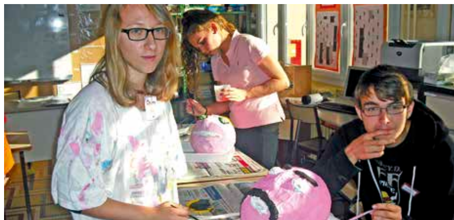
Travail en partenariat entre les 2ASST et les ULIS.