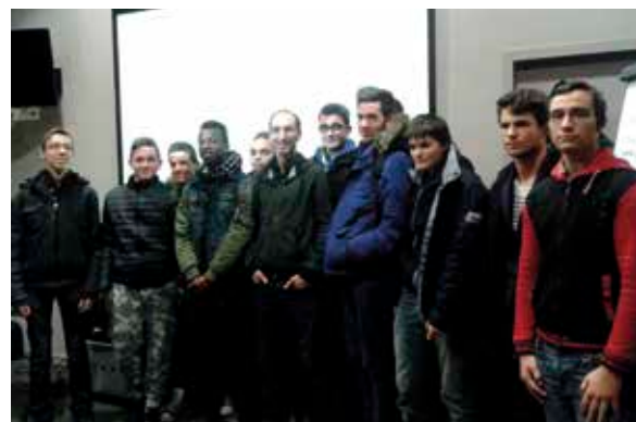
La classe de 2 nd e LT à l'issue de la rencontre avec Gaël Aymon (au centre).

Dans le cadre de Libre 2 Lire en partenariat avec la ville d'Angers, la classe de 2LT a rencontré le 6 février à la médiathèque Nelson Mandela (quartier Hauts de Saint-Aubin) l'auteur Gaël Aymon.