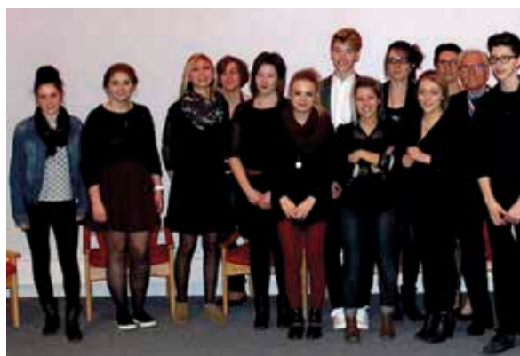
Les candidats au concours départemental 2015.

Le lundi 16 mars se déroulait à la CCI d'Angers le concours Meilleur Apprenti Coiffure (MAF sélection départementale). Trois élèves de CAP coiffure 2 e année représentaient la section ITEC du lycée Joseph Wresinski.