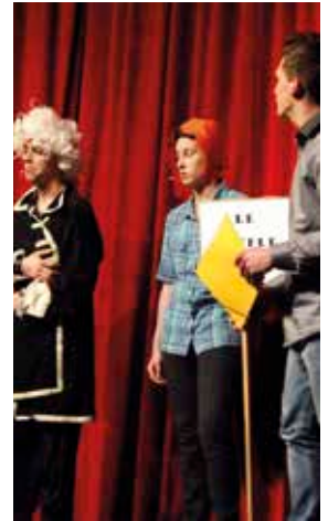
« La Révolution », sketch des Inconnus revisité par Auriane, Erwan et Florian.