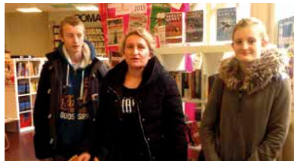
Discussion avec une famille à l'issue de la visite du lycée.

Le lycée a ouvert ses portes le 31 janvier et le 28 mars. Dans chaque section, des élèves ont été sollicités pour se mettre au service des familles venues visiter l'établissement.