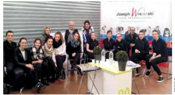
Les 1ECP ont assuré des soins de modelage bien appréciés.