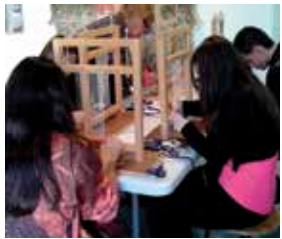
Initiation au tissage pour les jeunes de CAP MMV au musée Jean Lurçat.

La visite du musée Jean Lurçat à Angers s'inscrit dans la découverte d'un métier lié à la formation Métiers de la mode et du vêtement. Lors de cette sortie pédagogique, deux médiatrices culturelles ont emmené la classe de CAP MMV1 voir la tapisserie « Le chant du monde » de Jean Lurçat. Ensuite, ce fut la découverte de deux autres artistes de la tapisserie contemporaine : Thomas Gleb l'allemand et Josep Grau Garriga qui, lui, est d'origine espagnole. Ils ont tous des styles différents. Pour finir, la participation à un atelier pour apprendre à tisser avec différents matériaux (corde, fil plastique, tissu, laine, etc.) fut une découverte divertissante et instructive.