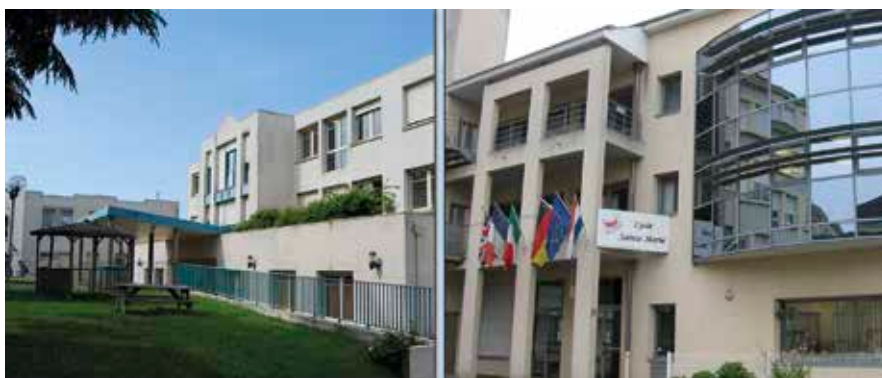
Les sites Sainte-Marie et Saint-Serge.

J'ose espérer que vous saurez appréhender dans ces quelques pages, l'esprit vraiment particulier de ce lycée où l'accueil de tous est véritablement vécu, où la solidarité est de mise, où la valorisation de chacun est un axe développé avec une attention particulière. Un grand « merci » à nouveau aux élèves et à leurs professeurs qui ont œuvré pour la réussite de ce numéro, véritable exercice d'écriture auquel il n'est pas simple d'adhérer. Ce nu-