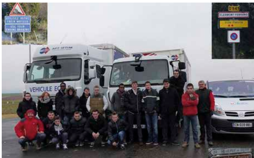
La classe de CRM2 lors du séjour en Auvergne.

Les véhicules lourds se sont arrêtés dans des villages au Lac Chambon, La Tour-d'Auvergne, Chastreix et Clermont-Ferrand. « Ce fut un séjour très enrichissant pour les élèves. Ils ont pu découvrir et apprendre la conduite en montagne, différente de la région angevine.