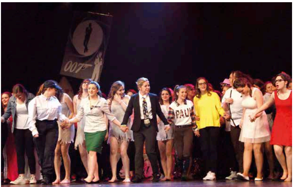
Salut final pour l'ensemble des acteurs de cette soirée.