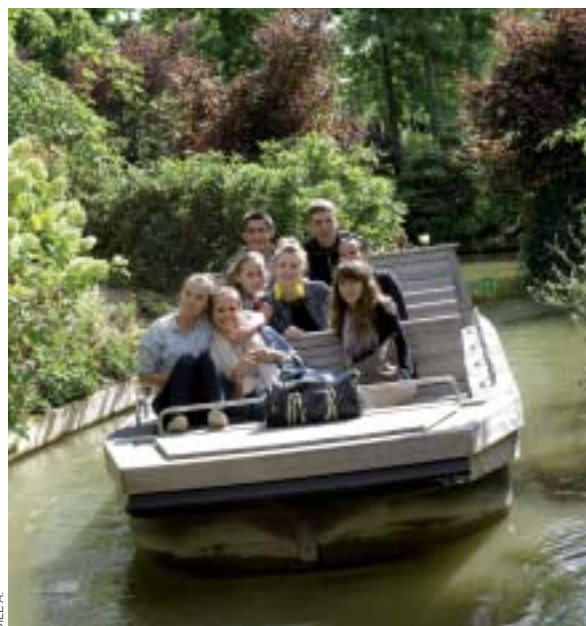
Les élèves de 2ASSP ont passé une journée d'intégration au parc végétal.