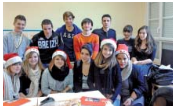
Comenius fait des heureux!