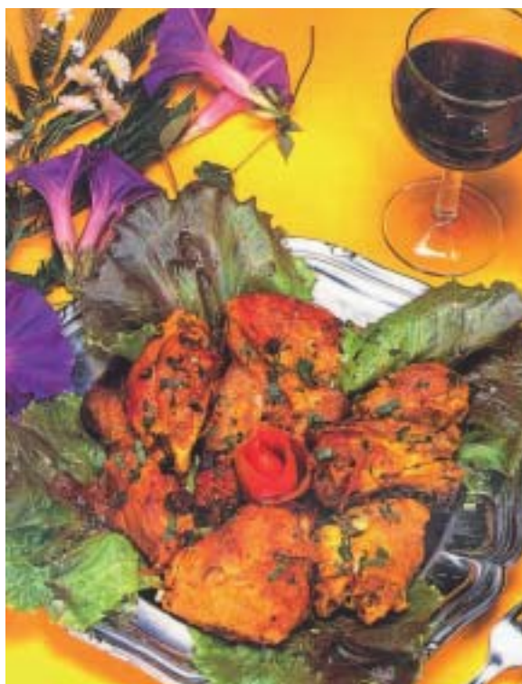
Carry de poulet.