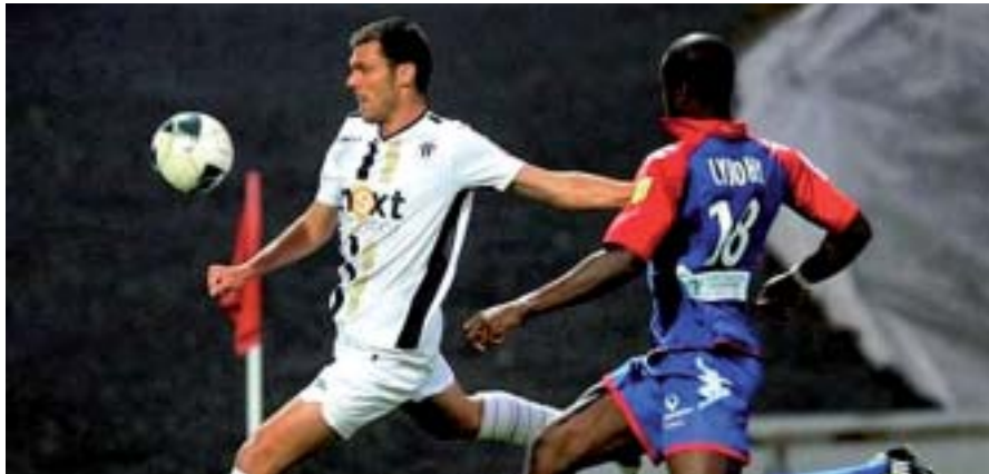
Soir de match au stade Jean Bouin : le Sco contre Châteauroux.