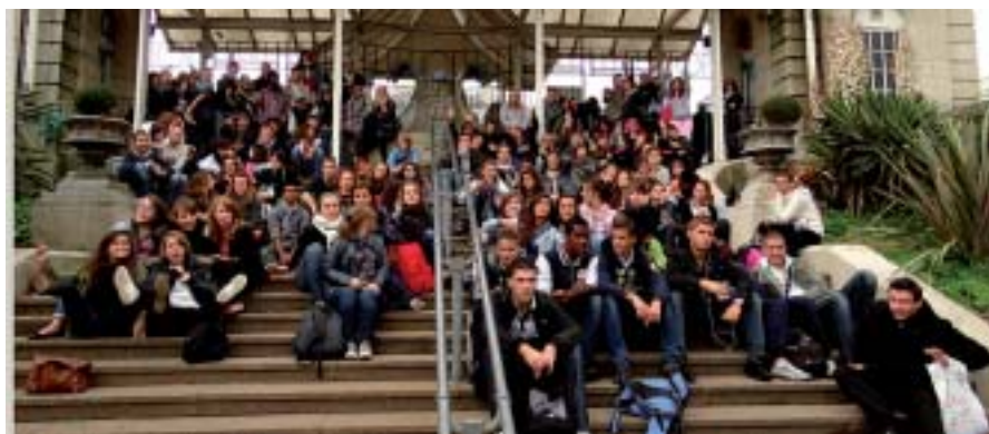
Le groupe de lycéens devant l'aquarium Sea life.

Cent seize élèves ainsi que neuf enseignants de Sainte-Marie sont partis en Angleterre du 23 au 29 septembre. Tout le monde était pressé pour cette visite «So British!».