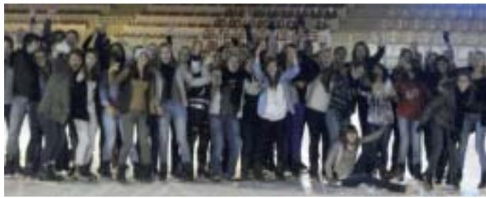
Les filles internes à la patinoire à la veille des vacances.

À 19h, les estomacs sont vides, direction le dîner. De 19h30 à 21h30, l'internat ouvre ainsi que les douches et les toilettes.