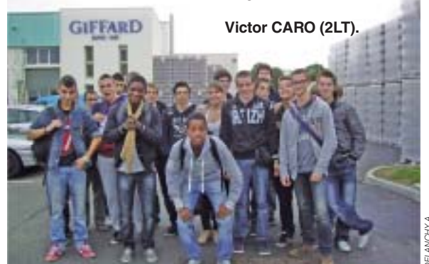
Les sirops Giffard ont une réputation mondiale.