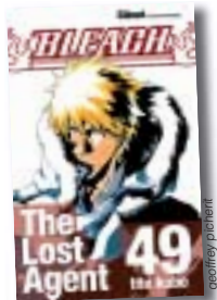
La 1 re de couverture du manga Bleach.

Bleach est un manga écrit par Tite Kubo : il nous fait découvrir la vie d'Ichigo Kurosaki, un lycéen tout à fait normal mis à part le fait qu'il peut voir les fantômes. Pour autant, il est loin de s'imaginer l'existence des «Chinigami» (Dieux de la Mort) et de la «oul society» (paradis). Mais un jour, un monstre appelé Hollow apparaît et veut dévorer Ichigo. Il rencontre alors la jeune Chinigami, Rukia Kuchiki toute vêtue d'un kimono. Gravement blessée, Rukia n'a pas d'autre choix que de transférer une partie de ses pouvoirs à Ichigo. Il se voit donc obligé de l'aider dans cette mission jusqu'à ce qu'elle se rétablisse.