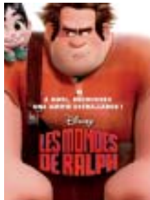
L'affiche du film.

Les mondes de Ralph retracent l'histoire d'un héros mal aimé d'un jeu des années quatre-vingt, Ralph la casse. Etant rejeté de tous et fatigué de ses 30 ans de travail, il décide de quitter le jeu avec en tête un nouveau but: prouver à tous qu'il peut devenir un héros. Après avoir fait une thérapie de groupe, il décide de se trouver un nouveau coin de paradis virtuel. Il va donc faire la connaissance de plusieurs héros de jeux vidéo, comme Sonic, Bowser, Clyde de Pac Man ou encore Zangief de street fighter II. Un film plein d'humour à découvrir. Les mondes de Ralph, un film consacré aux jeux vidéos réalisés par Walt Disney animation studio. Sortie le 5 décembre au cinéma.