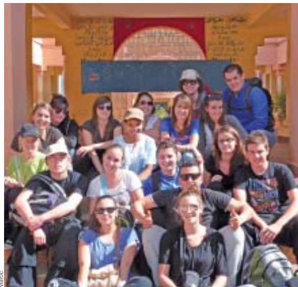
Les élèves de Sainte-Marie ont découvert une autre culture et des Marocains accueillants.