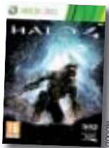
Sur xbox 360 le jeu le plus attendu de l'année.

L'histoire d'Halo 4 débute en 2557. Quatre ans après la destruction de l'Arche et de l'un des Halos, la moitié du vaisseau L'Aube de l'Espérance erre toujours dans l'espace avec à son bord l'intelligence artificielle Cortana et le Spartan John-117 encore endormi dans son tube cryogénique. Le vaisseau se fait aborder par des troupes d'assaut Covenants. Cortana décide alors de réveiller le Master Chief de son sommeil. Master Chief remarque alors que l'Aube de l'Espérance est entraînée par une forte attraction venant d'une gigantesque planète à l'aspect Forerunner: Requiem. L'Aube de l'Espérance et plusieurs croiseurs Covenants s'approchent donc de cette mystérieuse planète qui est un monde-bouclier.