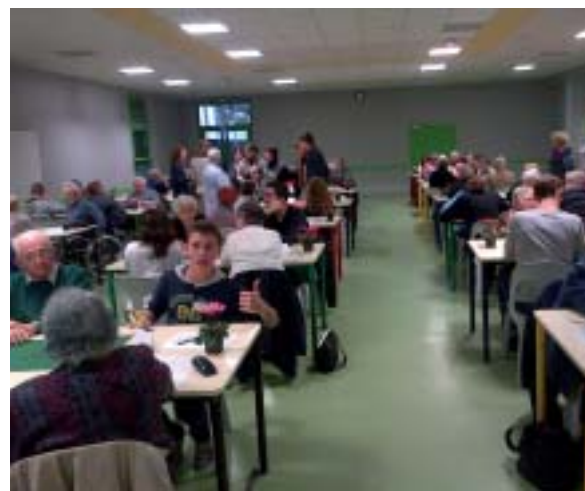
Les 2SPVL avec les retraités de la maison de retraite Sainte-Marie, Saint-Martin, et la Maison de Quartier des Hauts de Saint-Aubin.

Chaque année le lycée Sainte-Marie participe en collaboration avec la maison de quartier des Hauts de Saint-Aubin à la Semaine bleue : semaine nationale tournée vers l'intergénération ; le thème national cette année «Vieillir et agir ensemble dans la communauté».