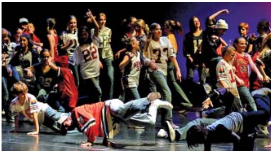
Chorégraphie lors d'un spectacle de hip-hop.