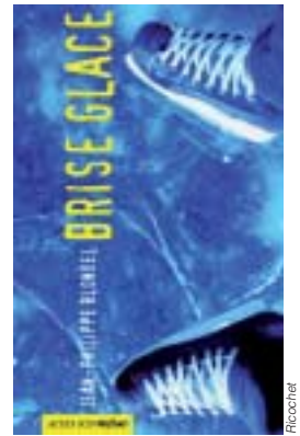
Un roman pour les ados.

En compétition pour le concours «J'ai lu, j'élis», l'auteur J.P. Blondel nous plonge dans l'univers bouleversant de trois adolescents. Amis pour la vie, ils ont juré d'être toujours là les uns pour les autres. Comme tous les jours, ils se sont donné rendez-vous. Ils jouent, se taquent, se défient. Leurs vies basculent un dimanche d'hiver. Le silence reposant de la neige, les jeux d'enfants, puis le silence pesant qui succède aux malheurs. J.-P. Blondel nous fait partager les tourments d'un adolescent perdu qui ne peut plus avancer, submergé par ses souvenirs qui le dévorent. Un roman passionnant, émouvant.