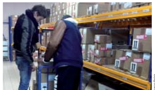
Deux élèves de 3PP1 font le tri des colis.