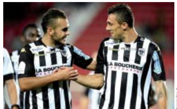
Bon début de saison pour les joueurs du SCO.