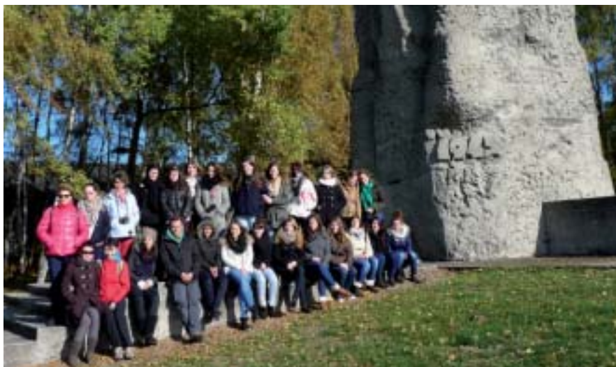
Le groupe d'élèves et professeurs de TASST lors de la visite du camp de Stutthof.

Sur place, l'accueil était assuré par des profs et étudiants polonais âgés de 19 à 26 ans. D'ailleurs la communication était parfois un peu compliquée. «On a dû parler en anglais tout en essayant d'apprendre des mots polonais comme bonjour ou au revoir» explique une des élèves. Logé la première nuit dans un internat, le groupe a dormi le reste de la semaine dans une auberge de jeunesse. Les élèves ont jugé Torún comme «une cité médiévale agréable