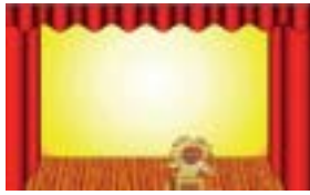
Le web pédagogique

Je dirige un atelier de théâtre pour enfants.