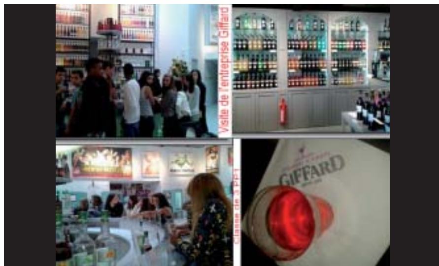
Dégustation de sirops chez Giffard.