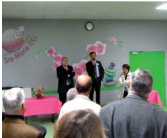
Soirée d'inauguration de l'ITEC lundi 14 octobre 2013.

Merci donc aux élèves de l'ITEC pour ce souffle nouveau, aux professeurs et personnels de cette structure qui ont pu trouver au sein du lycée les raisons d'envisager l'avenir avec espoir et sérénité en y apportant leur professionnalisme, leur dynamisme et leur