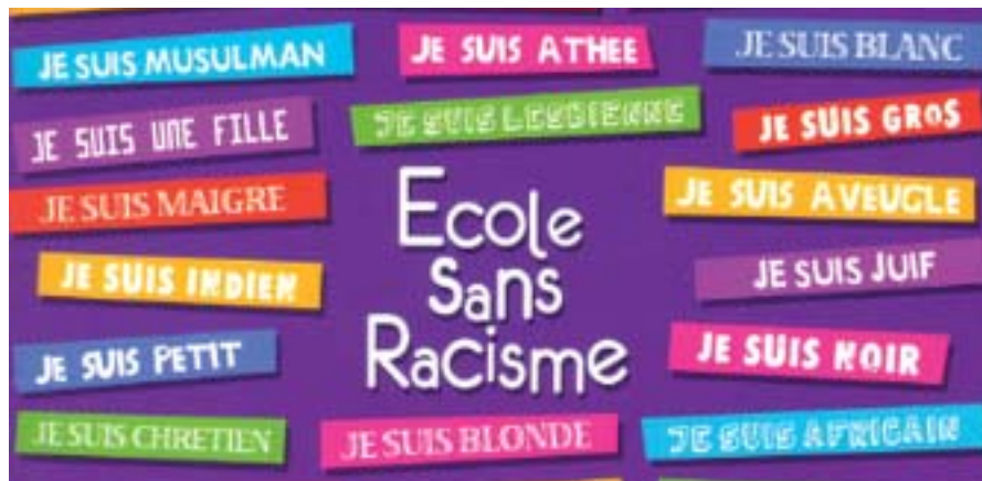
Une plaque pour combattre les discriminations au sein de notre établissement.