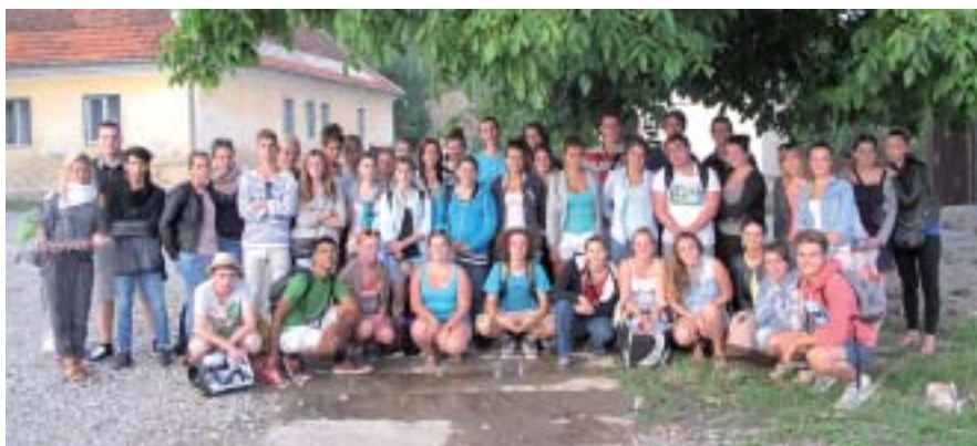
La classe de Terminale SPVL a vécu une expérience inoubliable.

Durant l'année de 1 er , les élèves de SPVL ont préparé ce « Voyage » (*Calatorii en roumain). Quatre heures par semaine étaient consacrées à la recherche d'activités à réaliser une fois sur place.