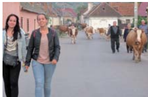
Purcareni ou les charmes de la campagne roumaine !

Ce petit village d'un peu moins de 2000 habitants est devenu touristique grâce à l'accueil des familles et l'Association l'Arbre de joie.