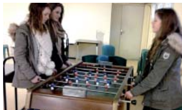
Le foyer va être relooké par des élèves de 1SPVL en 2014.

La classe de 1 re SPVL à l'effectif de 25 élèves s'est engagée à rénover le foyer.