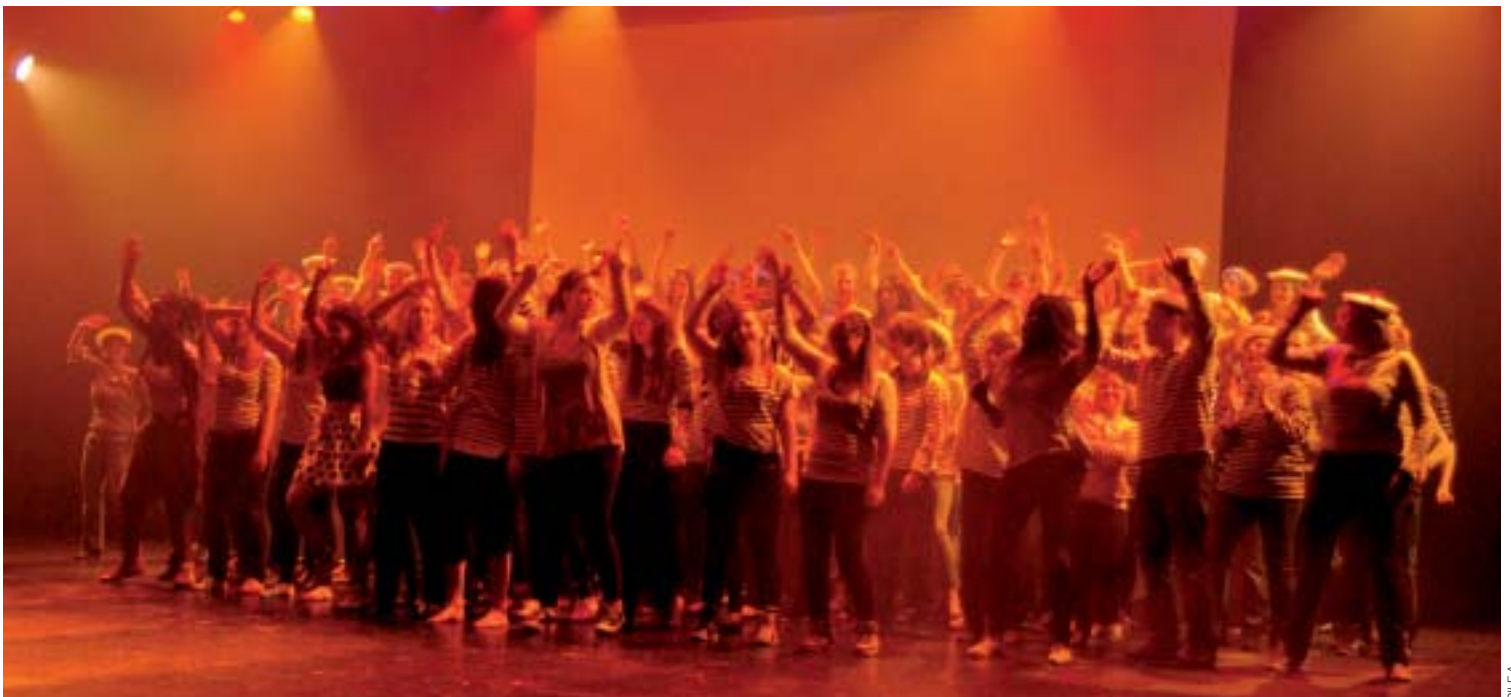
Larguez les amarres, suivez l'étendard. Tous sur scène pour l'entrée.