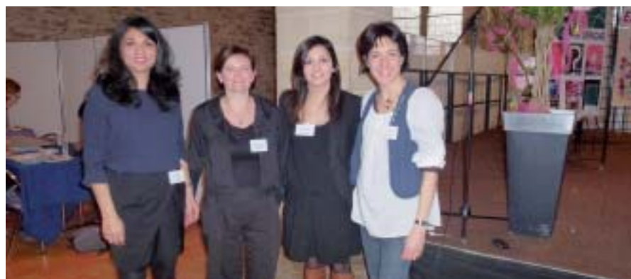
Une partie de l'équipe organisatrice du forum.