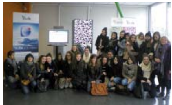
Les secondes GA devant une armoire à serveur.