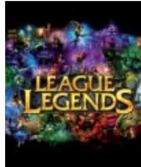
League of legend en ligne.

League of legend est un Multiplayer Online Battle Aréna. C'est un jeu gratuit en ligne. Vous vous ferez surnommer « invocateur ». Il y a 3 cartes, 110 champions, 187 objets différents et 4 modes de jeu actuellement. - Coop vs IA, personnalisé : vous vous battez contre l'ordinateur. - Classique : vous vous battez contre d'autres invocateurs. - Draft : comme le mode classique sauf que vous voyez les champions ennemis et devez supprimer 3 champions pour le temps de la partie. - Classer : comme le mode draft sauf que vous jouez avec votre équipe classée à partir du niveau 30.