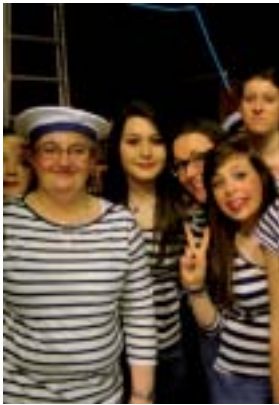
Attention au départ: 1, 2, 3 pour un soir. Les marinières à l'honneur!