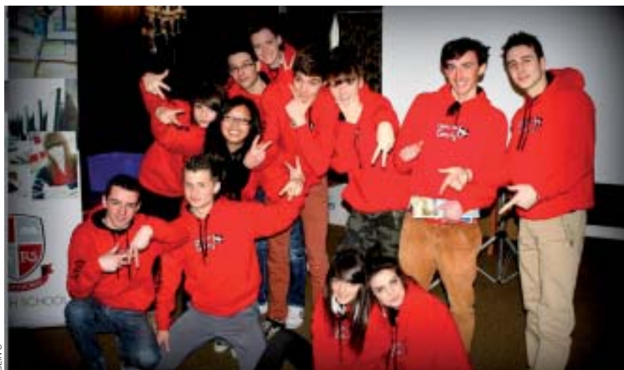
La groupe Comenius a passé une semaine in Cornwall.

Le programme de la semaine fut très varié et mouvementé : nombreuses visites dans la jour-