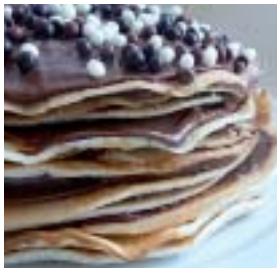
Gâteau de crêpes au nutella.

Pour 6 personnes : - 2 œufs - 125g de farine - 25cl de lait - 1 pincée de sel pour les blancs - nutella - bonbons pour la décoration (facultatif) Préparation de la recette : Préparer une pâte à crêpes avec les jaunes d'œufs, la farine et le lait. Monter les blancs en neige avec une pincée de sel et les incorporer à la pâte. Faire cuire les crêpes assez épaisses. Disposer dans un plat une première crêpe puis la recouvrir de nutella. Finir avec la dernière crêpe et recouvrir le haut du gâteau de nutella. Décorer avec les bonbons (facultatif).