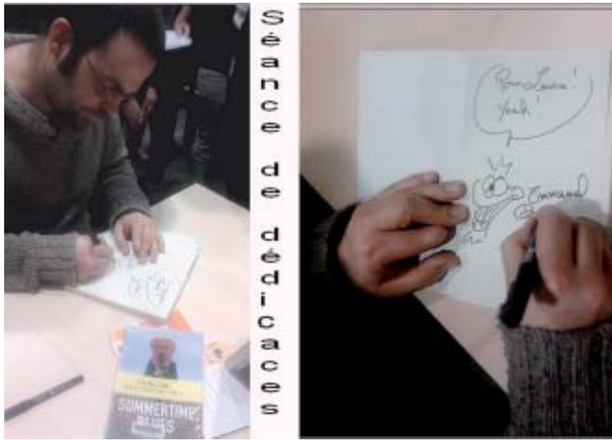
L'auteur s'est prêté avec plaisir à une séance de dédicaces des romans.

Au mois d'octobre dernier, les élèves sont allés à la médiathèque « Nelson Mandela »