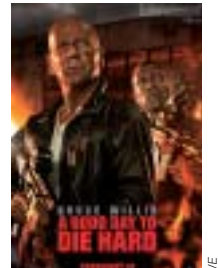
Pas vraiment nouveau.

Cette fois-ci, John McClane, le flic qui ne fait pas dans la demi-mesure, est vraiment au mauvais endroit au mauvais moment après s'être rendu à Moscou pour aider son fils Jack qu'il avait perdu de vue. Ce qu'il ignore, c'est que Jack est en réalité un agent de la CIA en mission pour empêcher un vol d'armes nucléaires. Avec la mafia russe à leur poursuite et la menace d'une guerre imminente, les deux McClane vont découvrir que leurs méthodes radicalement différentes vont aussi faire d'eux des héros que rien ne peut arrêter. Les critiques en général sont mauvaises car ce dernier Die Hard n'a pour eux aucune surprise cinématographique. Pour des personnes qui n'ont pas vu les précédents, ce film est génial.