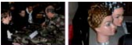
Greniers St Jean, forum Groupe Maine 2013