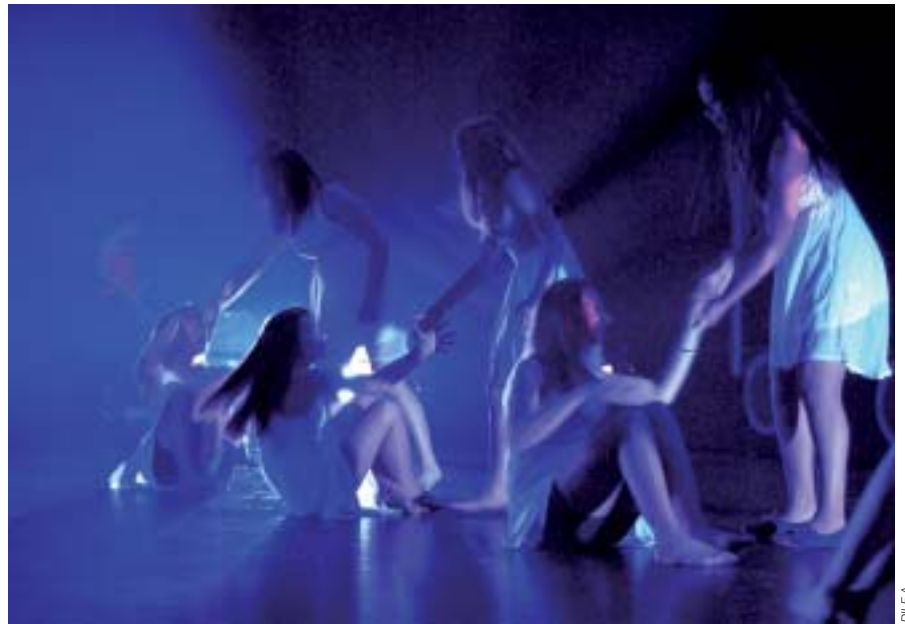
Danse sur la musique Skyfall (Adèle)