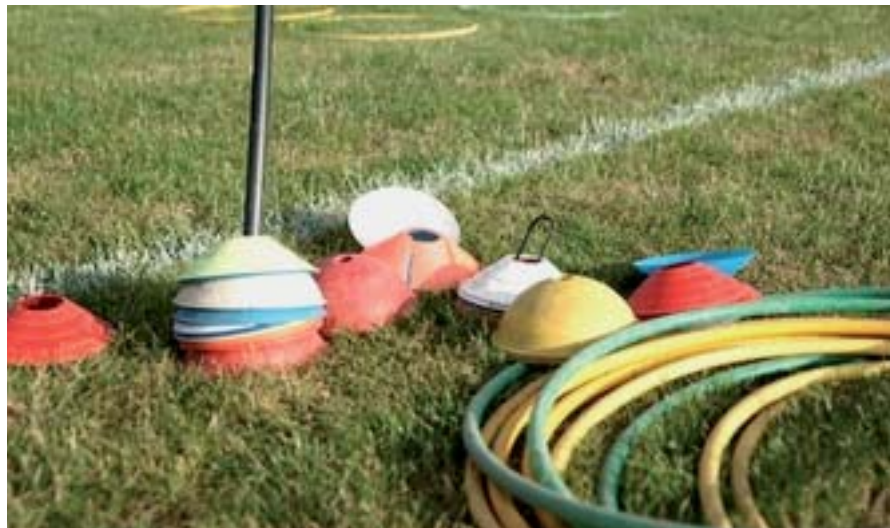
Des ateliers de motricité pour éduquer les jeunes à ce sport.