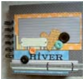
Exemple de scrapbooking.

La photographie est une passion permettant de faire diverses choses avec les clichés : soit des albums photos, du scrapbooking ou encore, différentes créations. On peut prendre en photo, soit un paysage, soit des personnes, soit des couleurs (jeux de lumières, ciel,...),... Nous pouvons créer des albums photos sur Internet ou pour nous mêmes. Ils peuvent être offerts ou gardés chez nous en souvenir. Nous pouvons aussi faire du scrapbooking : nous mettons en valeur des photos en les collant dans un album et en le décorant par nos propres moyens et notre propre originalité.