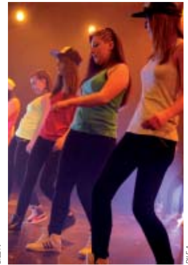
Un p'tit air de zumba sur la scène du théâtre Chanzy avec les ASSP.