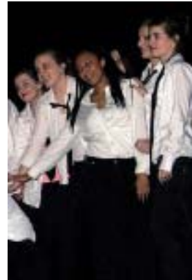
Danse « Sans Contrefaçon » de Myleine Farmer.