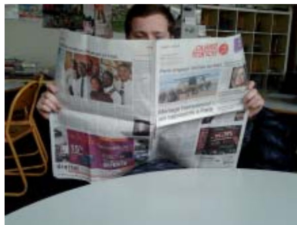
À la une de la presse, l'intervention française au Mali.

Suite aux violences faites par AQMI (Al-Qaïda au Maghreb islamique), le président D. Traoré a appelé le président François Hollande à intervenir au Mali pour protéger la population malienne.