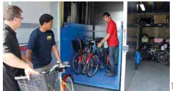
AMS a également la charge d'entretenir les 2500 vélos de Vélocité Angers.

Les missions d'Angers Mob Services sont de favoriser la mobilité des demandeurs d'emploi via un service de location de deux-roues, de voitures et de voitures sans permis. AMS existe depuis 2002 et permet à des personnes rencontrant de grandes difficultés d'insertion sociale et professionnelle de se remobiliser autour d'une activité, de se former et de retrouver un rythme de travail et les comportements nécessaires pour accéder à l'emploi et le conserver.