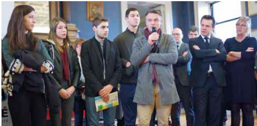
La cérémonie du centenaire a eu lieu à la mairie d'Angers en présence d'élèves du lycée.