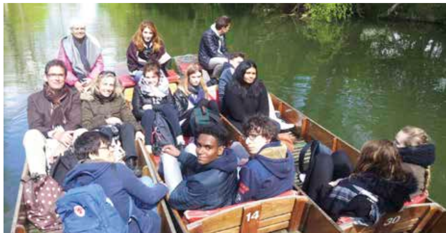
« Punting in Oxford » (bateau plat), a quiet experience for students and teachers.