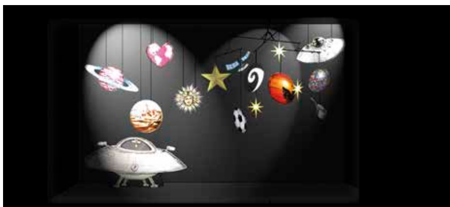
Le visuel du projet de décors Chanzy 2017 réalisé par M. Manceau.

Pour cette année, une quinzaine de pièces différentes.