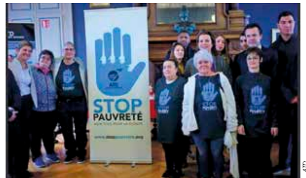
En présence d'élèves du lycée, la campagne de mobilisation ATD « Stop Pauvreté », officiellement lancée à la mairie d'Angers le 12 février 2016.

Le mouvement ATD (Agir Tous pour la Dignité Quart monde) a été créé en 1957 par le père Joseph Wresinski avec des familles vivant dans un camp de logement à Noisy-le-Grand (banlieue parisienne). Ce camp avait été installé par le Mouvement Emmaüs et son fondateur l'abbé Pierre. L'objectif d'ATD Quart monde est l'éradication de l'extrême pauvreté. Le principe fondateur est que ceux qui subissent cette situation doivent être les premiers acteurs de leur propre promotion. Il fait appel à l'engagement de chaque citoyen pour transformer les mentalités et poser des actes concrets de solidarité.