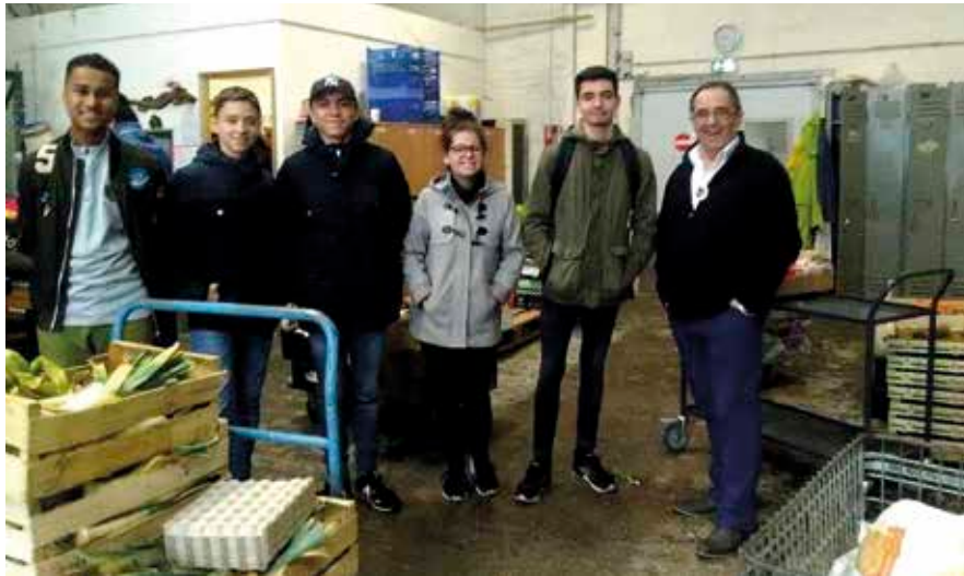
Une partie du groupe 2SPVL dans la zone logistique de réception et stockage de la nourriture.

Malgré la tragique disparition de Coluche en 1987, une nouvelle campagne s'organisait et des associations départementales se créaient portant