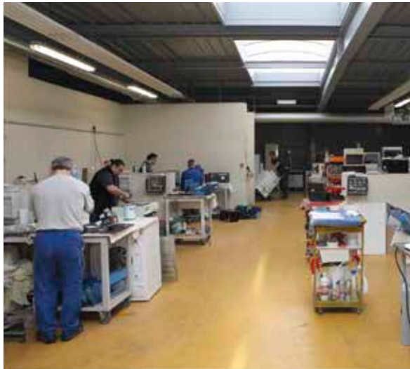
L'électroménager pas cher, rénové et garanti, c'est à Envie Anjou.