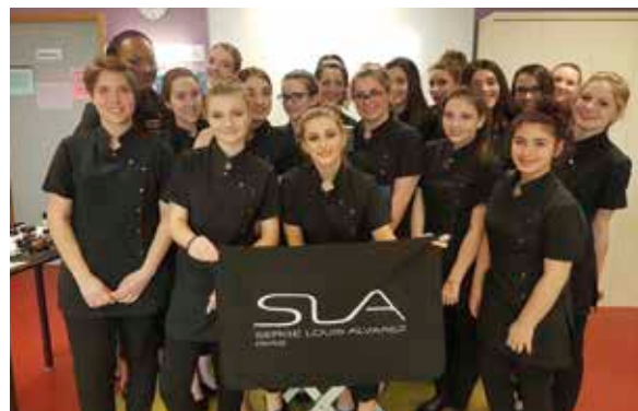
Intervention de SLA pour la classe de 2 nd e ECP.

Une conférencière de la marque SLA, spécialisée dans les produits de maquillage, est venue parler de l'entreprise le jeudi 9 mars au lycée.