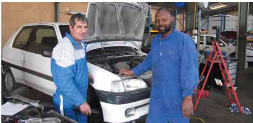
Solidarauto 49, une entreprise qui carbure à la générosité en favorisant l'insertion.