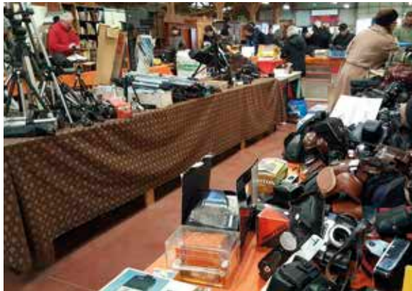
La communauté Emmaüs de Saint-Jean-de-Linières, près d'Angers, propose régulièrement des ventes thématiques.

Les différents acteurs de cette association sont « les compagnes et les compagnons » (les personnes accueillies), les