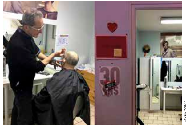
Parmi les bénévoles des Restos, un coiffeur retraité assure une permanence.

« Ici, les coups de ciseaux sont gratuits! » Ce coiffeur retraité, qui a exercé auparavant dans un salon du côté de La Possonnière, offre aux bénéficiaires des Restos un moment privilégié, « un temps pour soi ».