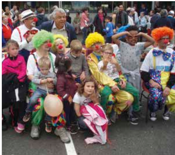
Des actions sur le terrain pour créer du lien et vivre des temps de partage.