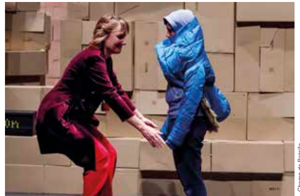
Le combat d'une mère pour son enfant autiste.

Pendant la semaine du 6 mars 2017, au théâtre du Champ de Bataille à Angers, 8 classes d'élèves ont assisté à des représentations de la pièce « Clandestin, voyage en autisme », mise en scène par Marie Gaultier.