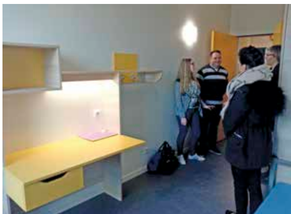
Lors des portes ouvertes du lycée, une chambre témoin était ouverte pour les visiteurs.

Pour l'organisation du soir, il y aura 1h30 d'étude obligatoire