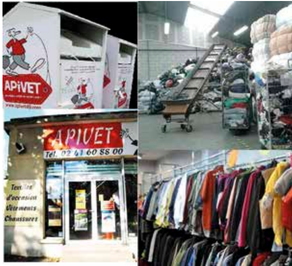
La collecte, le tri et la vente de vêtements d'occasion chez APIVET.

Il y a trois objectifs à APIVET : le réemploi, le recyclage, le chiffre industriel. Cent quarante-six points d'apport volontaire (conteneurs) sont disséminés dans toute l'agglomération angevine. Il permettent de récolter 1 250 tonnes de vêtements de toutes sortes par an (chiffre officiel 2016 pour l'association angevine comprenant des vêtements, du linge de maison et des chaussures). APIVET assure aussi au-delà de ses activités locales des exportations de ravitaillement pour l'Afrique. L'entreprise est composée de