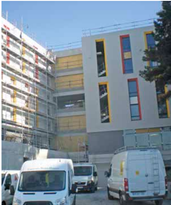
Les travaux avancent pour l'ouverture de l'internat et du nouveau lycée conforme à l'esprit de J. Wresinski.

Nous avons célébré en février dernier les 100 ans du père Joseph Wresinski. Nous sommes fiers du nom que porte aujourd'hui notre lycée, tant les valeurs de cet homme, tant sa vie, tant ce qu'il a incarné correspondent à notre philosophie, à notre histoire, à celle que nous souhaitons construire et vivre avec les jeunes confiés. Joseph Wresinski s'est battu contre la misère du peuple, en tentant de leur redonner l'estime d'eux-mêmes, la parole, l'autonomie afin que chaque personne puisse retrouver la dignité, puisse travailler, être solidaire. Il a voulu transformer « l'urgence » en un combat quotidien contre la dépendance, contre l'assistanat. Il a amené alors les gens à se prendre en charge, mettant en